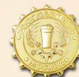
«ВЫБОР ПОТРЕБИТЕЛЯ - ЗОЛОТО»