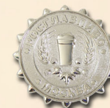
«ВЫБОР ПОТРЕБИТЕЛЯ - СЕРЕБРО»